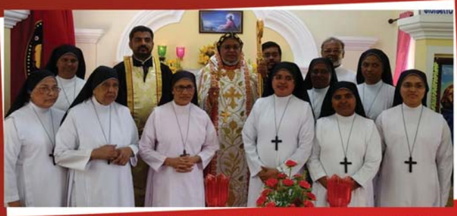
ലക്കിടി ഹോളി ട്രിനിറ്റി & ഹോളി ഫാമിലി പ്രാർത്ഥനാലയ കൂദാശയിൽ പങ്കെടുത്തവർ അഭിവന്ദ്യ പിതാവിനോടൊപ്പം