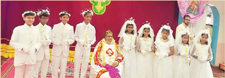
സെന്റ് മേരീസ് മലങ്കര കത്തോലിക്കാ ദേവാലയം, ഹൈദരാബാദ്