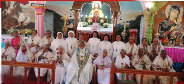
മാത്യുജോയിന്റ് അംഗങ്ങളുടെ നേതൃത്വത്തിൽ ഇടവകയിലെ സന്യസ്തരെയും മുതിർന്നവരെയും ആദരിക്കുന്നു