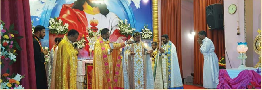
സെന്റ് ആന്റണീസ് തീർത്ഥാടന ദേവാലയം, ആനക്കല്ല്