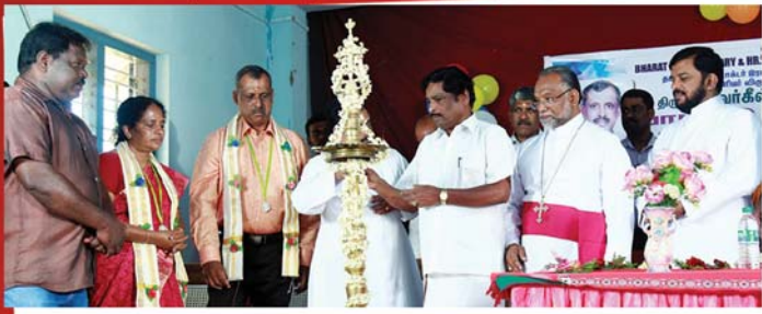
തമിഴ്നാട് സംസ്ഥാന അഡ്വൈസറിയുടെ അവാർഡ് ലഭിച്ച അഡ്വൈസറിയെ ആദരിച്ചപ്പോൾ