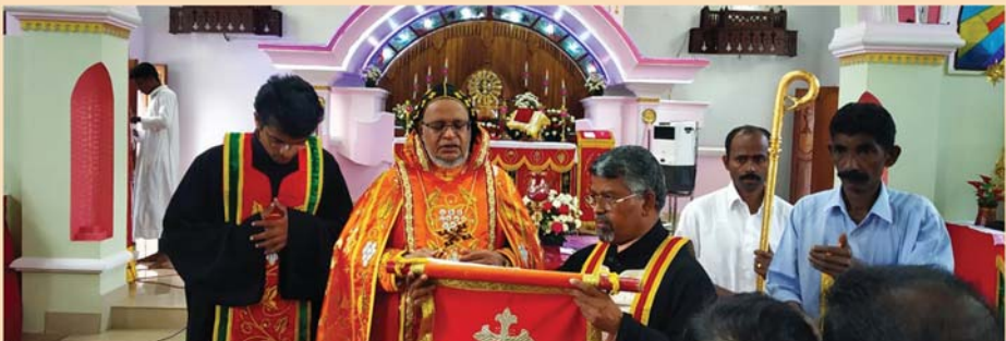
സെന്റ് മേരീസ് മലങ്കര കത്തോലിക്കാ ദേവാലയം, ചുനക്കര