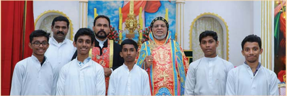
സെന്റ് മേരീസ് മലങ്കര കത്തോലിക്കാ ദേവാലയം, വലിയവിള