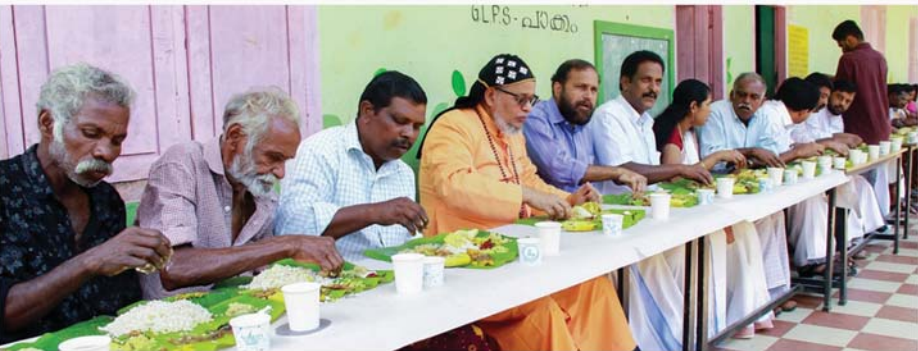
പാക്കം ദുരിതാശ്വാസ ക്യാമ്പിലെ ഭജനങ്ങൾക്കൊപ്പം അഭിവാദ്യ വിതാവ് ഓണസദ്യയിൽ പങ്കെടുക്കുന്നു

From: Chancellor, Bishop's House, Sulthan Bathery Wayanad, Kerala, India Tel: 04936 220207, 9446293293 email: exodusby@gmail.com