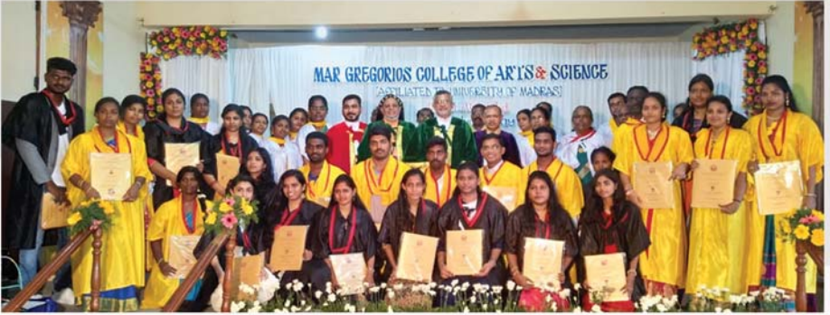
മാർ ഗ്രിഗോറിയോസ് ആർട്സ് & സയൻസ് കോളേജിൽ അവാർഡ് ദാന ചടങ്ങിൽ അഭിവാദ്യ വിതാവ് സംബന്ധിച്ചപ്പോൾ (ചെന്നൈ)