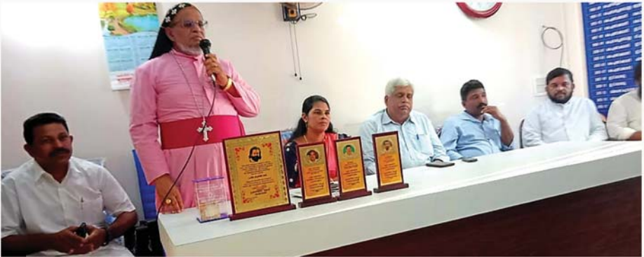
ഫ്രണ്ട്സ് ഓഫ് വയനാടിന്റെ മേഖലാ മീറ്റിംഗ് അഭിവാദ്യ വിതാവ് ഉദ്ഘാടനം ചെയ്യുന്നു